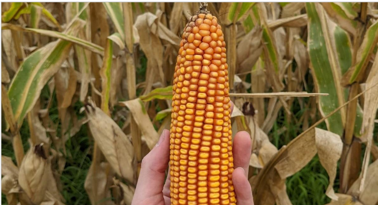
Lote de maíz temprano en madurez fisiológica. Rafaela, Santa Fe (03-02-22).

En la región del NOA, solo quedan por incorporar cuadros del cereal en la provincia de Salta. Por otro lado, en la zona del NEA mientras se relevar cuadros transitando estadios de expansión foliar, la siembra transita su tramo final. En las zonas Oeste de Buenos Aires-Norte de La Pampa, Cuenca del Salado y el Centro de Buenos Aires, parte de los sectores con excesos hídricos se fueron recuperando durante la última semana. Hacia la provincia de Córdoba, los planteos tardíos mantienen buenas condiciones en el sur y este provincial, pero son necesarias nuevas lluvias en los departamentos del norte para sostener las expectativas de rendimiento.