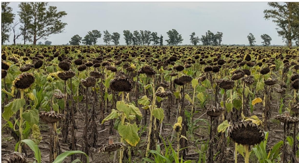
Girasol en madurez fisiológica. Rafaela, Santa Fe (03-02-22).

Sin embargo, en la franja sur, se observa una alta variabilidad en términos de rendimientos esperados. En sectores del centro y oeste bonaerense, los rindes alcanzarían valores cercanos al promedio, pero se detectan pérdidas de área por excesos hídricos. Al sur, las primeras expectativas de rendimiento se ubican entre 10 y 20 qq/Ha, que de confirmarse podrían reducir el volumen final de producción.