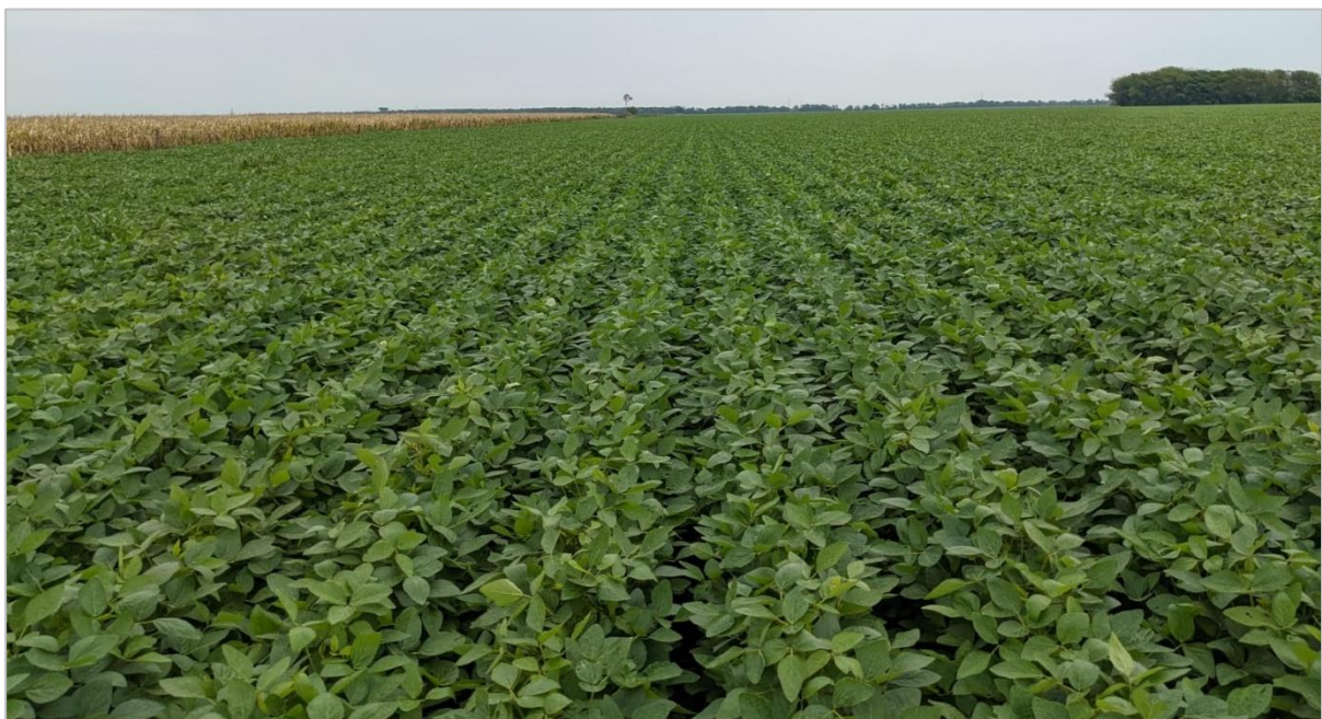
Lote de soja de primera en plena floración. Rafaela, Santa Fe (03-02-22).

Paralelamente, sobre el centro, importantes sectores informan una mejora en la condición hídricas tras las lluvias registradas durante los últimos diez días. Sin embargo, sobre el Núcleo Norte, aun se informa una condición hídrica regular sobre el 40 % del área sembrada, como consecuencia de los escasos y variables registros acumulados. La zona depende de nuevos frentes de tormenta para evitar mermas adicionales. Sobre el Norte de La Pampa-Oeste de Buenos Aires y el Centro de Buenos Aires, se relevan pérdidas de área como consecuencia de los anegamientos en sectores bajos que podría impactar sobre el potencial de producción.