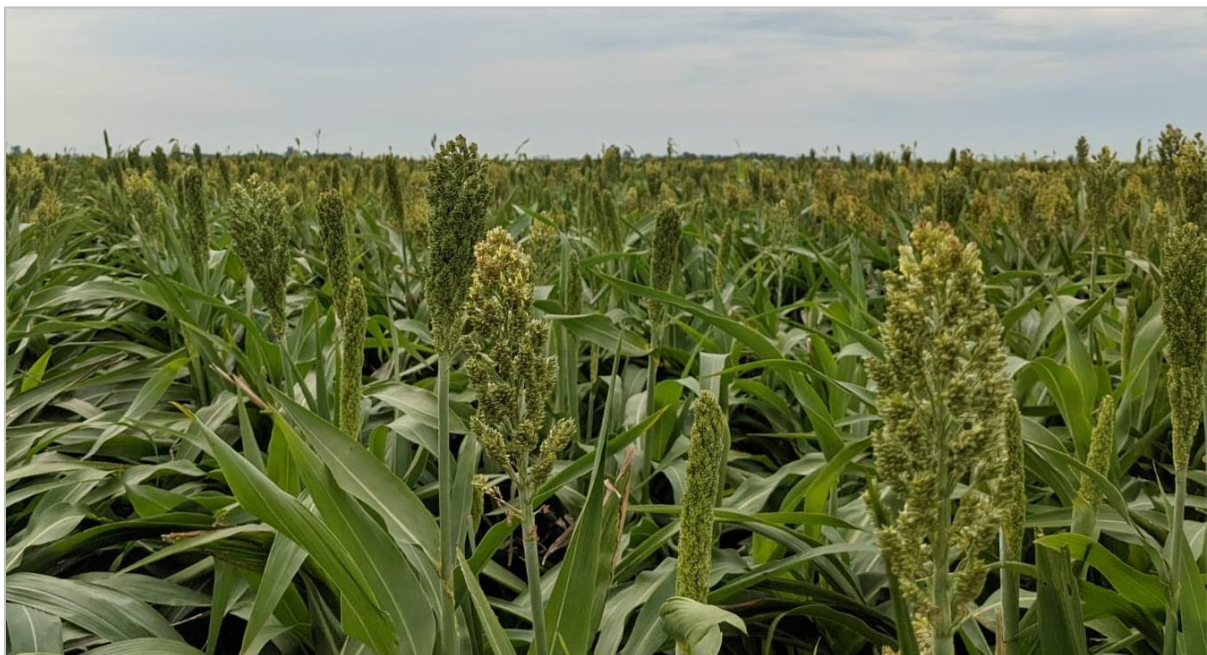
Lote de sorgo granífero panojando en buenas condiciones. Rafaela, Santa Fe (03-02-22).

En los Núcleos Norte y Sur, las lluvias mejoraron el estado de los cuadros del cereal de verano mientras que en paralelo continúan las aplicaciones para controlar pulgón. En las zonas Oeste de Buenos Aires-Norte de La Pampa, Cuenca del Salado y el Centro de Buenos Aires se reportan lotes con excesos hídricos puntuales en los sectores más tendidos del terreno. Hacia la zona Centro-Este de Entre Ríos a pesar de las últimas precipitaciones, parte de los lotes no recuperaron el potencial productivo. Sobre la región del Centro-Norte de Santa Fe, las labores de siembra culminaron durante los últimos quince días en los departamentos del norte.